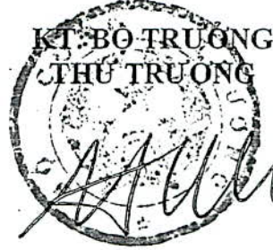
Cao Quốc Hưng